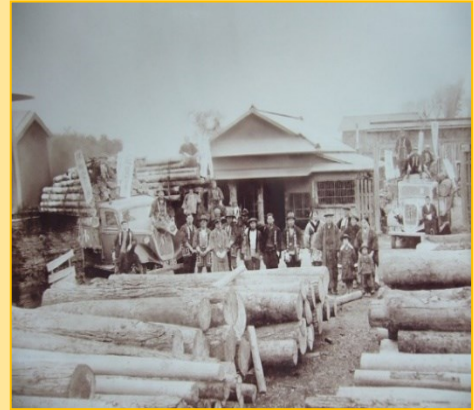
昭和10年頃の初荷の様子

この大きな節目を大切に なお一層皆様のお役に立てるよう社員一同精進して参りますのでどうぞ宜しくお願い致します。