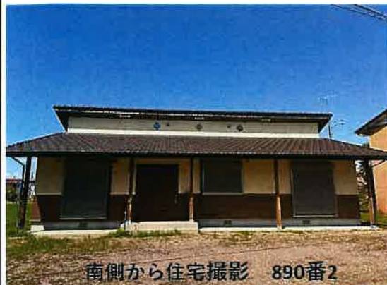
南側から住宅撮影 890番2